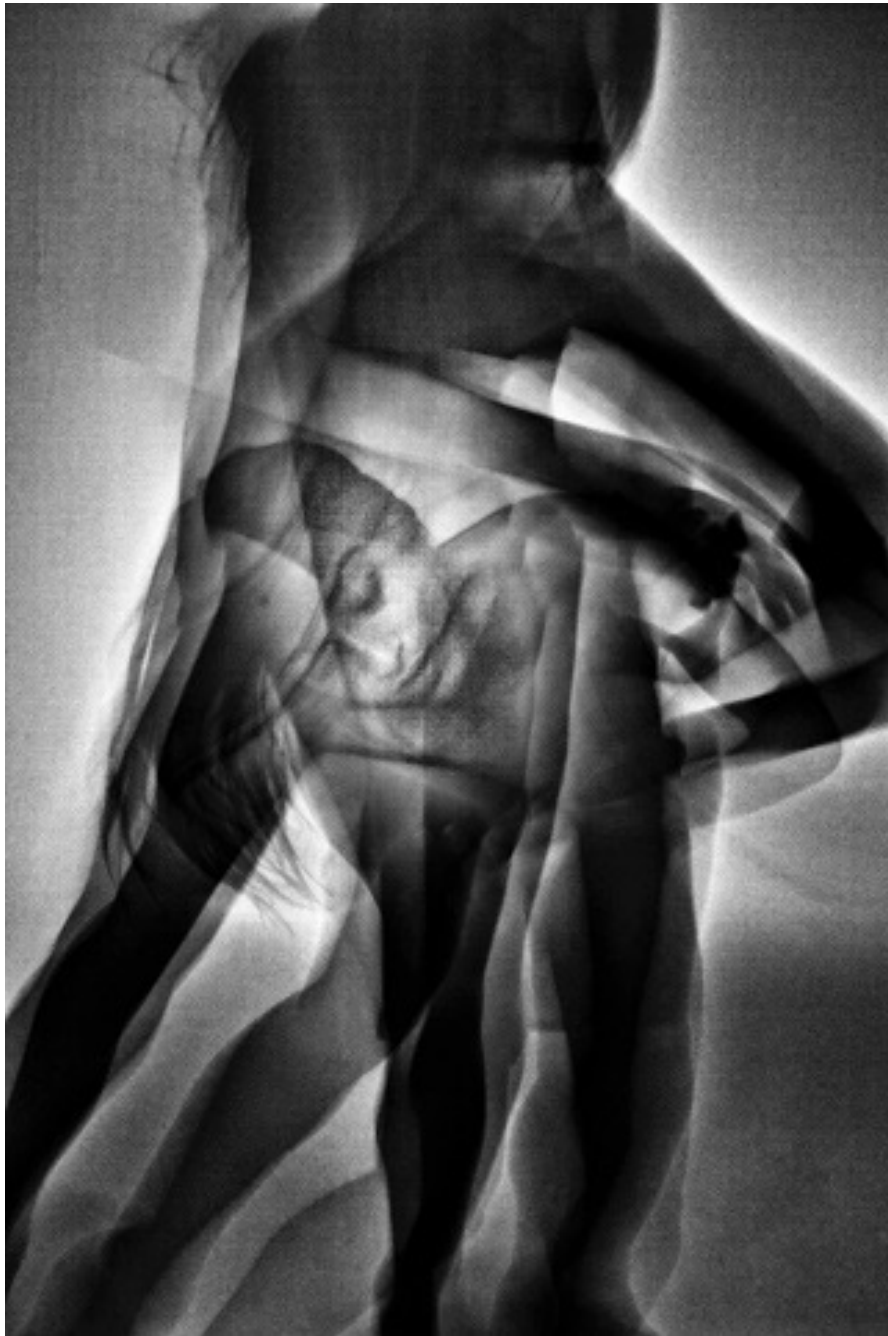
Letizia série Danseurs en Noir, 2013 tirage jet d'encre pigmentaire, 57 x 38 cm