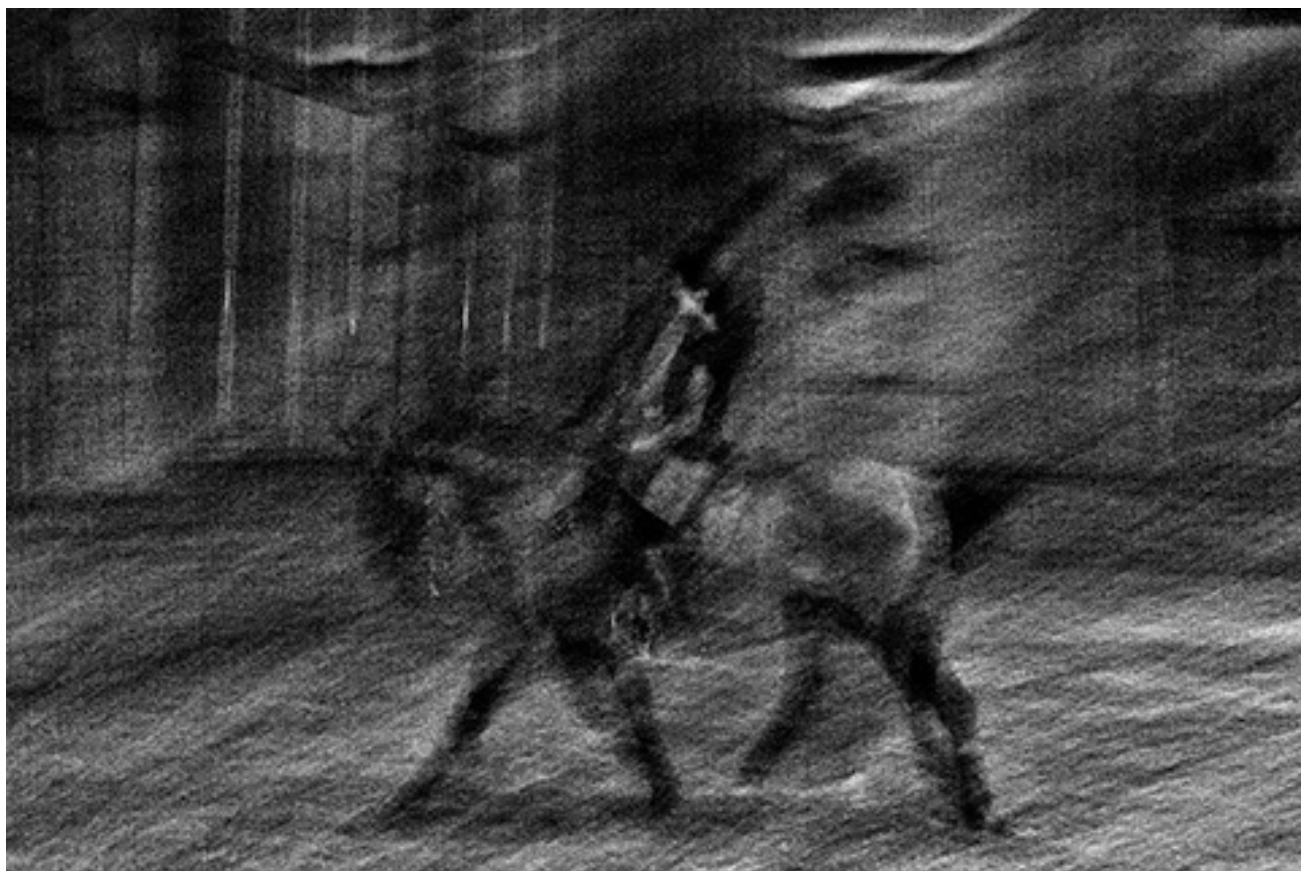
Le Grincheux série Académie Équestre de Versailles, 2014 tirage jet d'encre pigmentaire, 57 x 38 cm