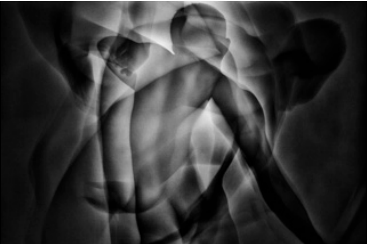
Mathieu série Danseurs en Noir, 2014 tirage jet d'encre pigmentaire, 57 x 38 cm