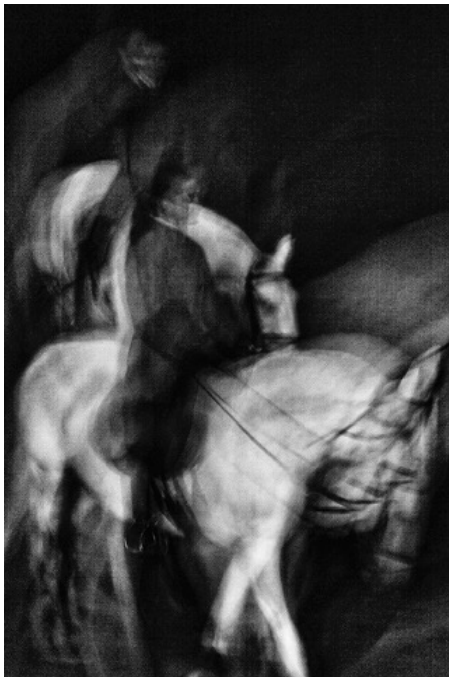
Trois série Académie Équestre de Versailles, 2015 tirage jet d'encre pigmentaire, 57 x 38 cm

Photographies libres de droits sur simple demande cathphilippot@relations-media.com