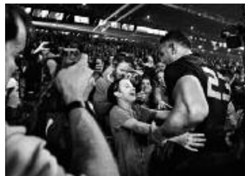
Coupe du Monde de rugby 2015 Finale : Nouvelle-Zélande / Australie (34-17) Le 31 octobre 2015 à Twickenham, Londres Jeune garçon dans les bras de Sonny Bill Williams après que ce dernier vient de lui offrir sa médaille.