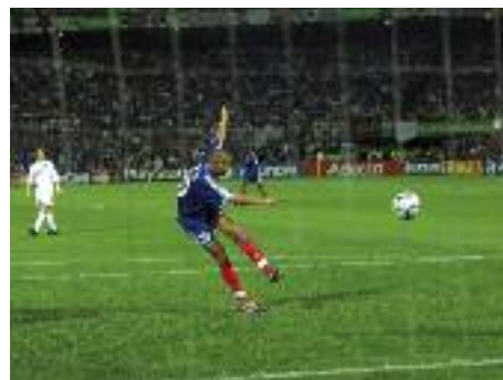
EURO 2000, 2 juillet, Stade de Kuip à Rotterdam. Le français David Trezeguet donne la victoire aux français contre l'Italie d'une reprise de volée du gauche. Un geste sublime pour une performance grandiose.