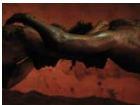
Inde, septembre 2014.