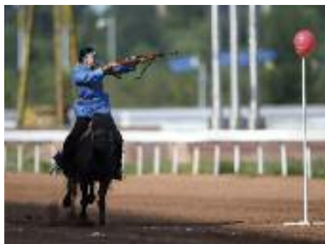
Une cavalière chinoise venue de la région autonome mongole intérieure, vise un ballon sur cheval lors des 10èmes Jeux nationaux traditionnels des minorités ethniques de la Chine à Ordos en Mongolie intérieure au nord de la Chine le 15 août 2015.