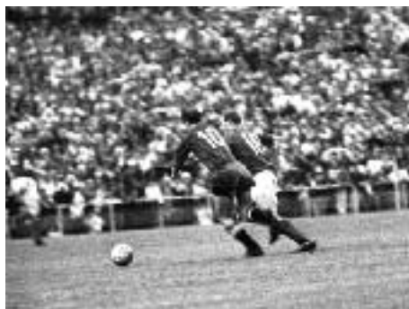
EURO 1964, 21 juin, Stade Santiago Bernabeu (Madrid), Luis Suarez (Espagne) prend le dessus sur le russe Alexeï Korneyev en finale.