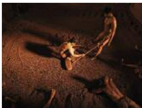
Inde, septembre 2014.