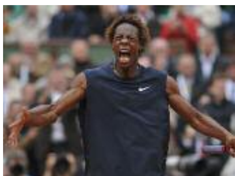
Monfils s'incline en demi-finale face à Roger Federer. 6 juin 2008.