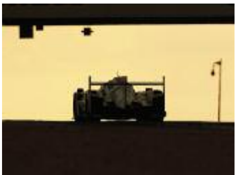
Circuit 24h du Mans, le 14 juin, 2015 à 7h02, Equipe Porsche 919.