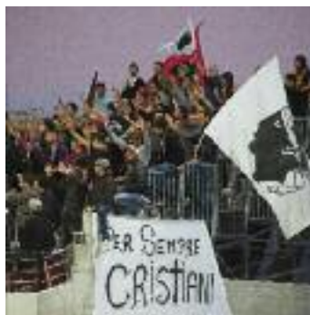
1969-Ajaccio 3 : La Sezione Guardia Storica, supporters du GFCA pendant le match contre le Stade rennais.