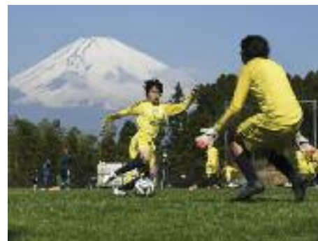
Les joueuses des moins de 14 ans de l'équipe Elite à l'entraînement à Susono proche du Mont Fuji, Japon, 30 mars 2015.