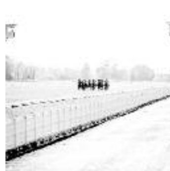
Hippodrome de Maisons-Laffitte. Avril 2015.