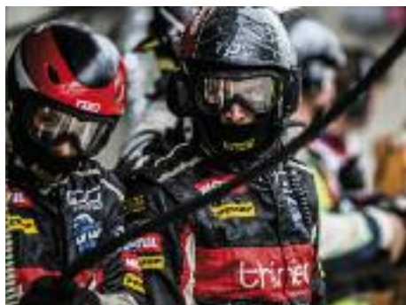
Circuit 24h du Mans, le 13 juin 2015 à 19H45.