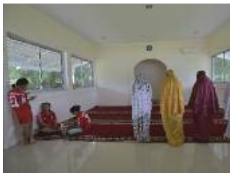
Cibur Soccer Club, Jakarta, Indonésie : des joueuses attendent leur tour pour la prière, 26 mars 2015.