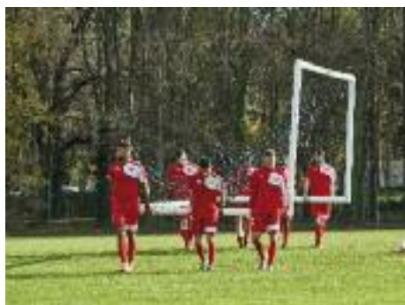
5 novembre 2015, entraînement du Nîmes Olympique au domaine de la Bastide.