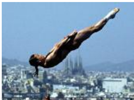
La plongeuse célèbre chinoise Guo Jingjing, en concours pour gagner la médaille d'or du tremplin 3m final des femmes aux Championnats du Monde de natation à Barcelone le 18 juillet 2003.