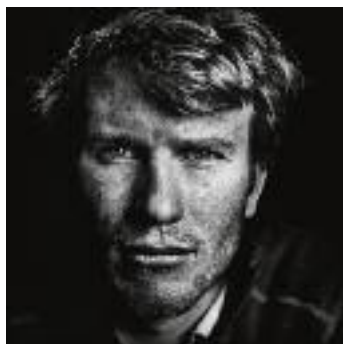
François Gabart.