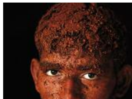
Inde, septembre 2014.