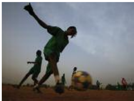
Séance d'entraînement de joueuses de football de l'équipe The Challenge près de Khartoum, Soudan, 13 août 2015.