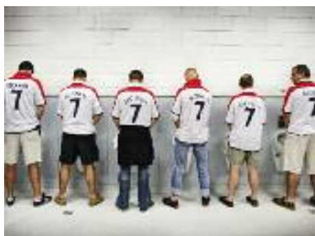
Lisbonne, le 21 juin 2004 lors la Coupe d'Europe des Nations. La Croatie et l'Angleterre dans le Groupe B avec la Suisse et la France.