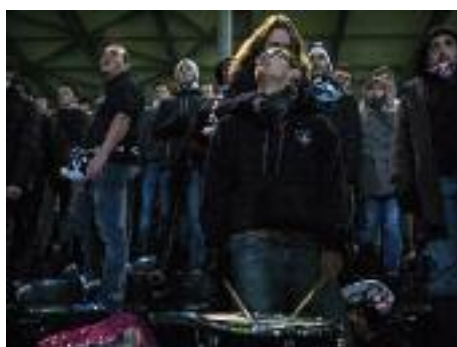
Des supporters du SCO Angers souffrent avec leur équipe, lors de la seconde mi-temps du 16e de finale de la Coupe de France opposant leur équipe à Bordeaux.