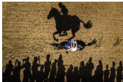
La cavalière thaïlandaise Nina Lamsam Ligon aux J.O. de 2012. Greenwich Park, Londres, le 30 juillet 2012.