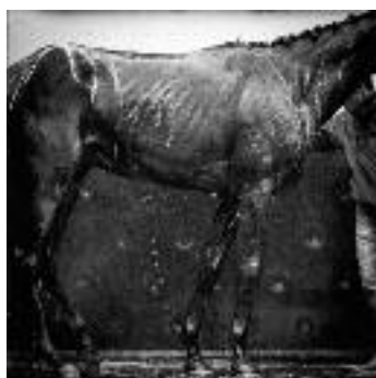
Hippodrome de Vincennes. Janvier 2015.