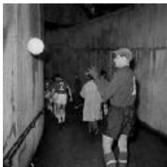
EURO 1960, 10 juillet, Parc des Princes (Paris), Le gardien de l'équipe d'URSS, Lev Yachine dans les couloirs qui mènent au terrain, avant d'affronter et de battre la Yougoslavie en finale.