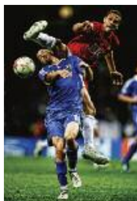
Mai 2008 au stade Luzhniki de Moscou lors de la finale de la Coupe UEFA. Champions League © Adrian Dennis / AFP.