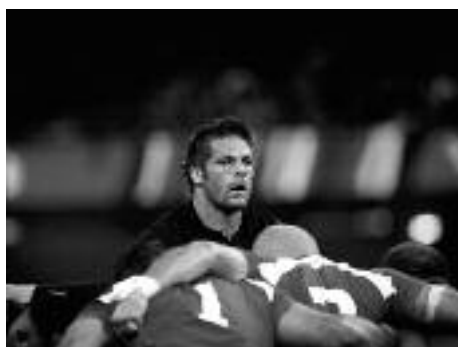
Coupe du Monde de Rugby 2015 Nouvelle Zélande/Géorgie (43-10) Le 02/10/2015 au Millenium Stadium, Cardiff Le capitaine Richie McCaw (NZ) avant une entrée en mêlée.