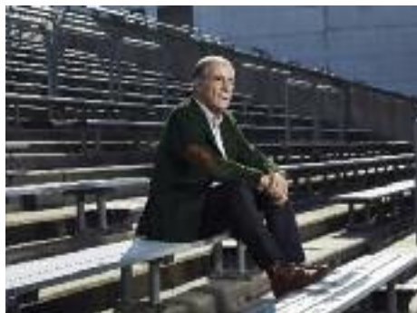
6 novembre 2015, le président de l'association Nîmes Olympique qui gère les amateurs, un fidèle.