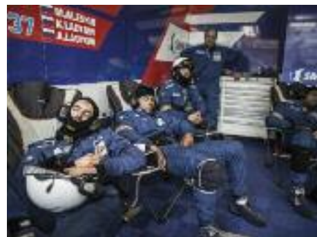
Circuit 24h du Mans, le 14 juin 2015 à 9H09, Equipe SMP.