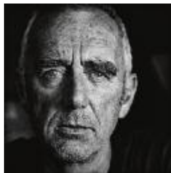
Loïck Peyron.