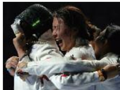
Les membres de l'équipe chinoise de l'épée dames célèbrent leur victoire sur leurs adversaires roumaines dans la finale aux Championnats du Monde d'escrime à Moscou le 18 Juillet 2015. Les Chinoises ont remporté finalement les médailles d'or.