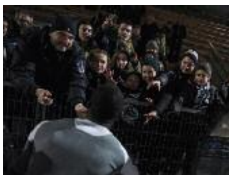
Un joueur du SCO Angers offre son maillot à des supporters, à l'issue du 16e de finale de la Coupe de France qui a opposé son équipe à Bor- deaux. Angers a été éliminé par deux buts à un.