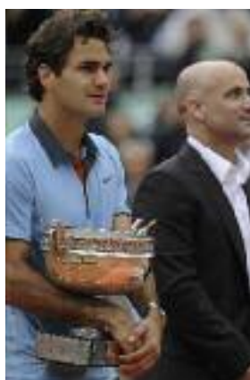
Federer bat Soderling tombeur de Nadal en 1/4. 6-1, 7-6, 6-4. le 7 juin 2009.