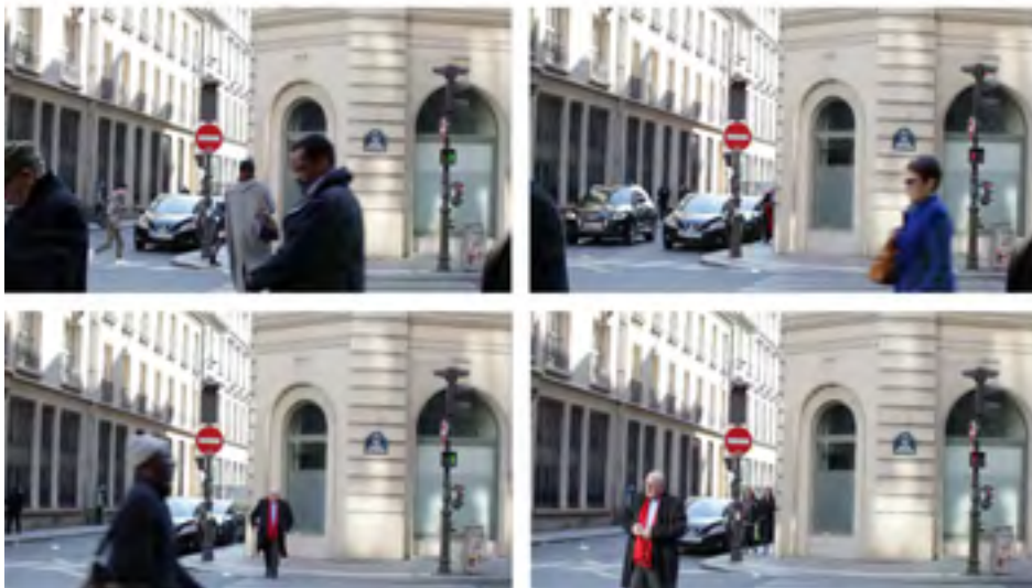
© Anna Malagrida / Carte blanche PMU