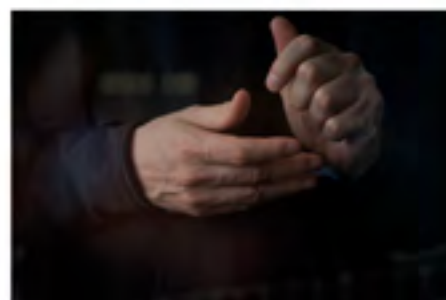
© Anna Malagrida / Carte blanche PMU