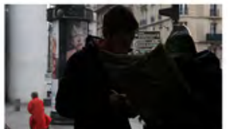
© Anna Malagrida / Carte blanche PMU