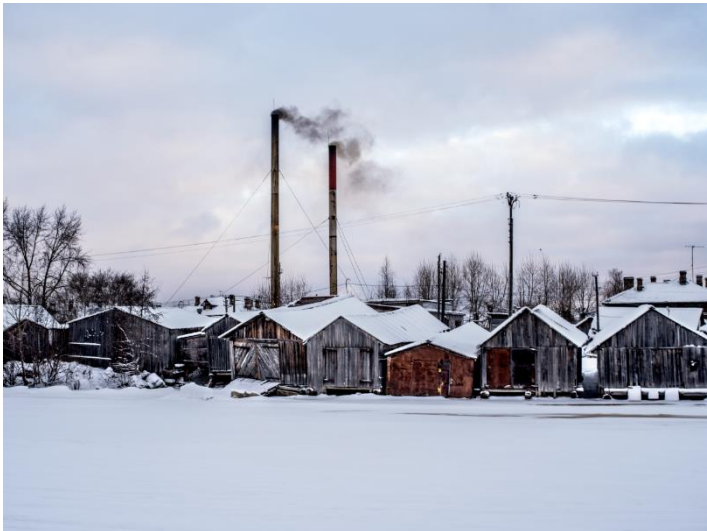
Sur l'île de Maïmaksä