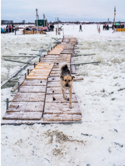
Le passage entre les îles de Solombala et de Khabarka