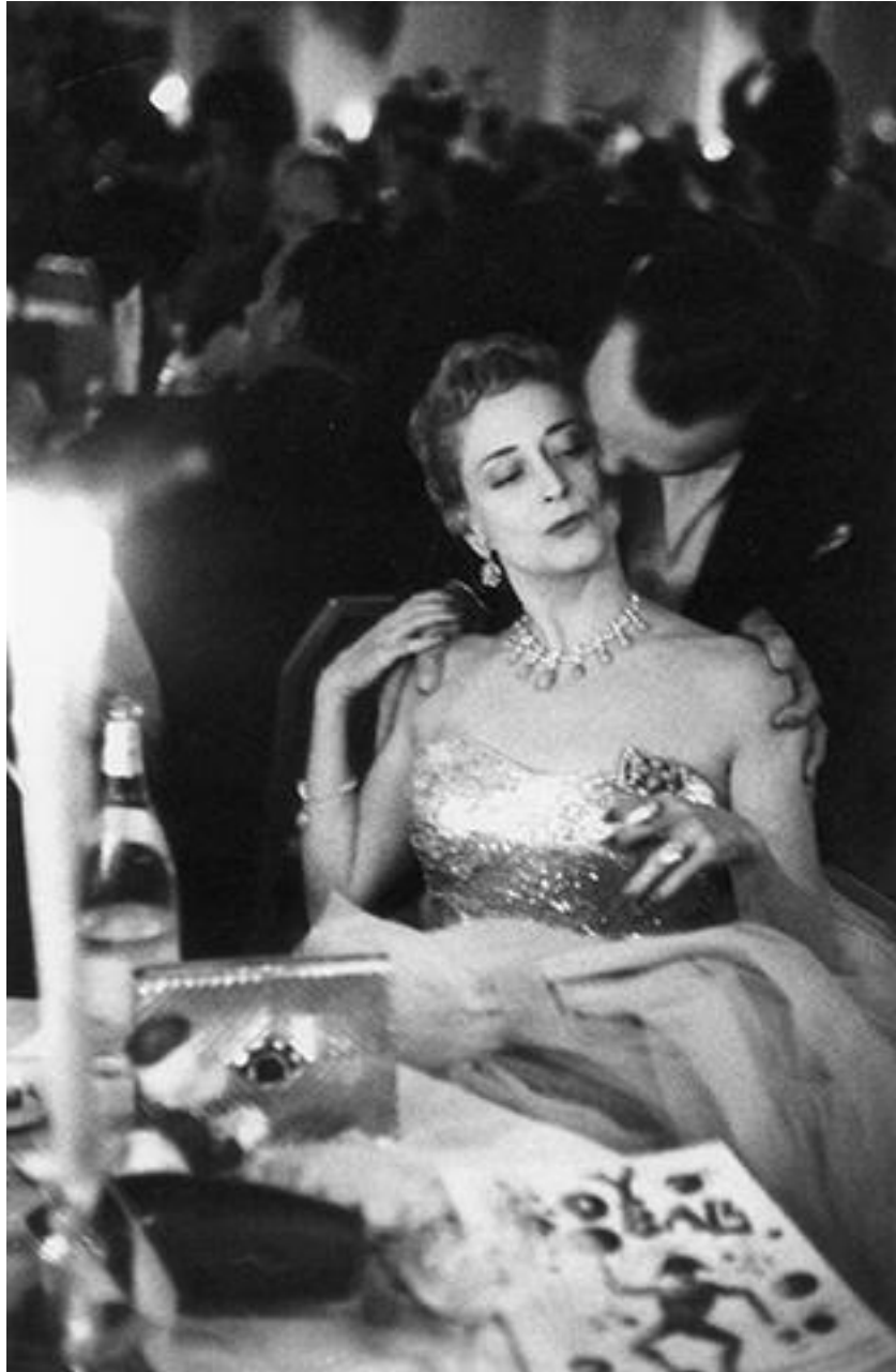
Charity ball – New York City, 1954