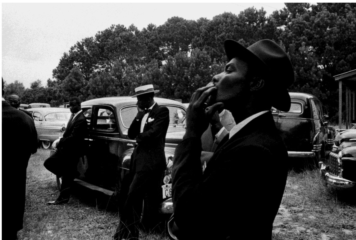
Funeral – St. Helena, South Carolina, 1955