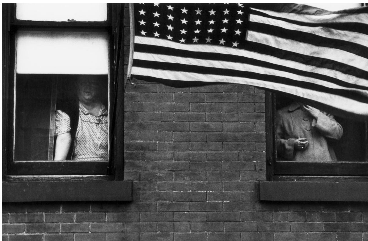
Parade – Hoboken, New Jersey, 1955