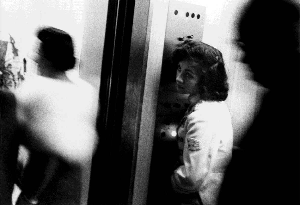
Elevator – Miami Beach, 1955