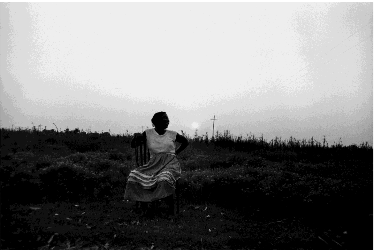
Beaufort, South Carolina, 1955