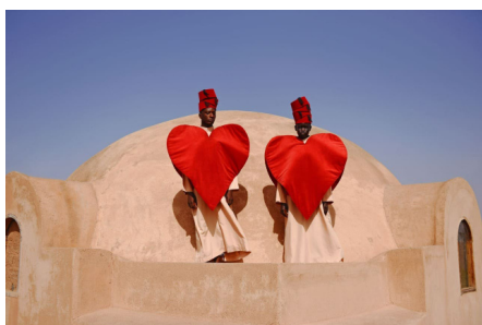
© Mous Lamrabat To the Moon and Back #2, 2021 Courtesy of Loft Gallery