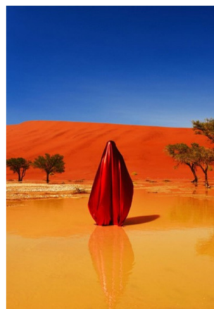
© Mous Lamrabat X-Rated #10, 2022 Courtesy of Loft Gallery