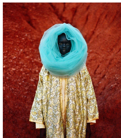
© Mous Lamrabat Block out that bad energy, 2021 Courtesy of Loft Gallery