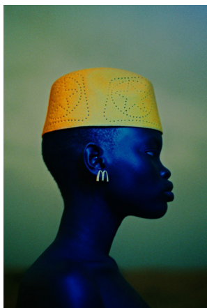
© Mous Lamrabat, Mashallah with extra cheese 2021 Courtesy of Loft Gallery