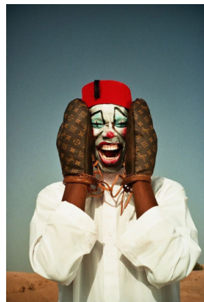
© Mous Lamrabat Louis the clown, 2021 Courtesy of Loft Gallery