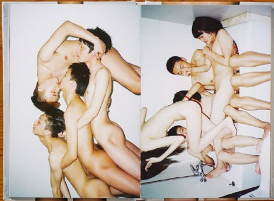
Nude by Ren Hang (China), self-published in 2012 Part of the Self Publish, Be Happy Collection at the MEP