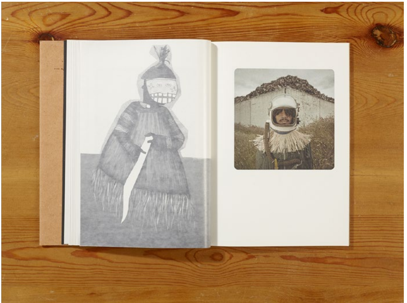
The Afnauts by Cristina de Middel (Spain), Self-published in 2012 Part of the Self Publish, Be Happy Collection at the MEP

"It is incredibly exciting and meaningful for us all that on the tenth anniversary of our organization, our collection of self-published books has found a permanent and beautiful home in the MEP library. Our original mission of collecting, looking after and promoting self-published photobooks via exhibitions, events and educational programmes is now accomplished. Today we are passing the baton to the MEP, which will now have the resources to preserve the work of a generation of photographers and keep it alive by making it available to students, scholars and the general public."