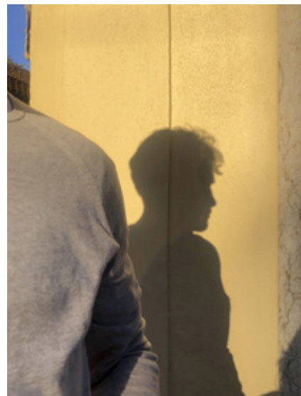
KHV3 Karla Hiraldo Voleau de la série « Another Love Story », 2021