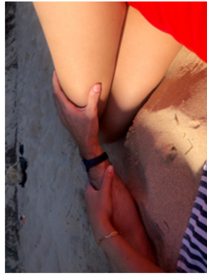
KHV2 Karla Hiraldo Voleau de la série « Another Love Story », 2021