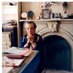
Image: Louise Bourgeois in her home on 20th Street in NYC, 2000