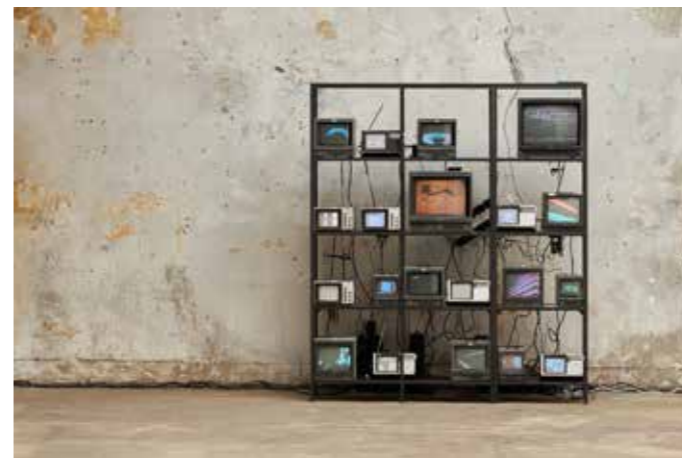
PXL CTY, 2021 © Antony Cairns

Les images presse sont libres de droits pour la promotion de l'exposition à la MEP. Elles ne peuvent être recadrées, modifiées ou contenir du texte.