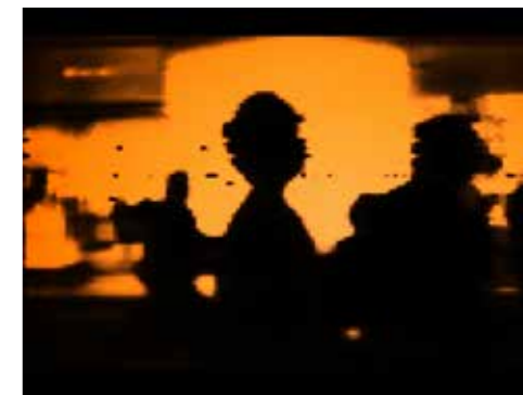
PXL CTY, 2021 © Antony Cairns