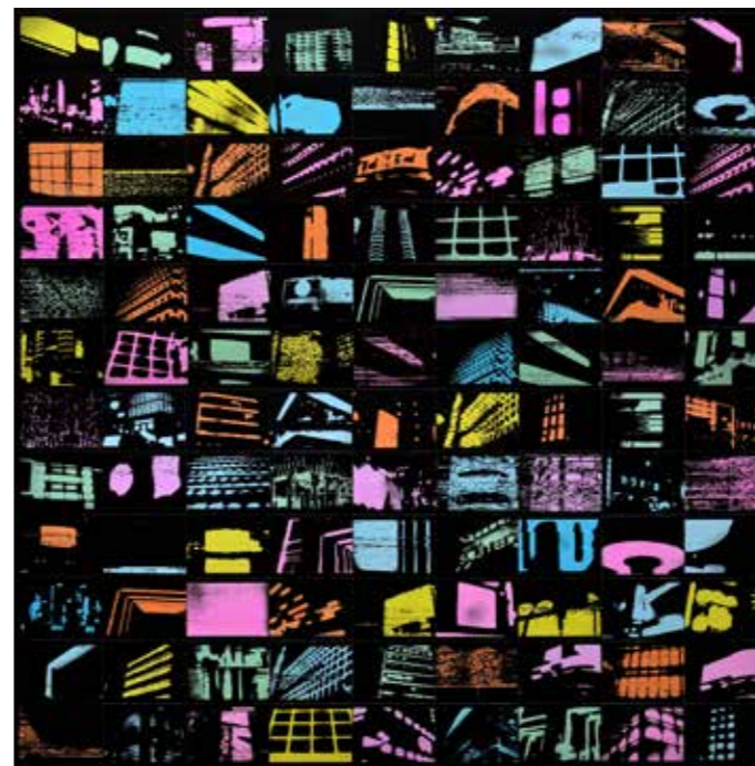
PXL CTY, 2021